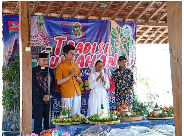
Memimpin Doa menurut kepercayaan Agama Katolik dalam acara Ruahan di RT. 01 Miliran