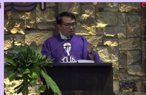
Diliput oleh : Sr. M. Vinsensia. OP

ringan hati dan selalu berjalan dalam kepasrahan pada Tuhan. Tentu saja dalam menjadi saksi Kristus, ada juga tantangannya. Salah satunya yang paling besar bagi Rm. Aan adalah menghayati kaul Kemurnian, Kemiskinan dan Ketaatan dalam perwujudannya sebagai seorang Imam yang hidup dalam Yesus sekaligus menjadi teladan bagi umat yang dilayani. Misalnya berusaha untuk tidak memanfaatkan jabatan atau posisinya sebagai seorang imam, agar dimudahkan dalam mendapatkan segala hal yang dibutuhkan ataupun diinginkan. Sebab beliau menyadari sungguh bahwa menjadi seorang imam berarti juga menjadi public figure bagi banyak orang, dipuji dimanapun dan bahkan seandainya ada sesuatu yang diperlukan pasti akan sangat mudah disediakan oleh umat. Inilah yang sering menjadi tantangan bagi beliau. Namun beliau mengakui dalam tantangan ini Allah sungguh berkarya didalam dirinya. Beliau tetap menyadari kehadirannya sebagai sosok utusan yang dipercayakan untuk melayani. Disinilah beliau menimba banyak Rahmat, sekalipun dihadapkan pada tantangan, beliau mampu kembali pada diri sendiri, melihat arti kehadirannya sebagai saksi Kristus. Diakhir wawancaranya, beliau memiliki harapan, semoga ditahun yang ber-Rahmat ini, beliau terus dimampukan menjadi seorang Imam yang baik dan sederhana di dalam pelayanan seperti yang diharapkan oleh Yesus sendiri.