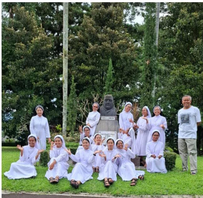
Rekreasi Komunitas ke Rumah Khalawat Roncalli