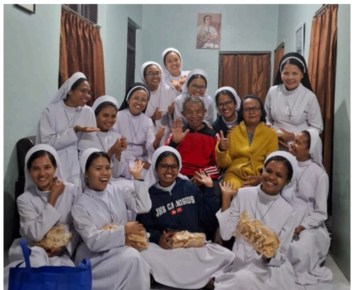
Kunjungan Komunitas ke Rumah Orangtua Rm. Aan, Pr